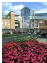
Sunderby sjukhus, Luleå