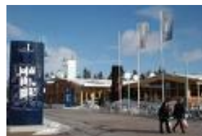
Regnbågsallen campus LTU