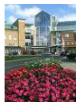
Sunderby sjukhus, Luleå