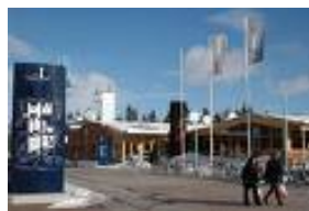
Regnbågsallen campus LTU