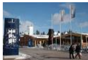
Regnbågsallen campus LTU