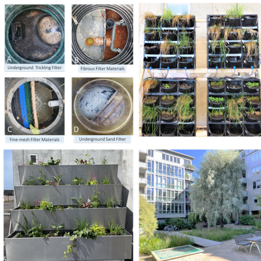
Figur: Olika typer av BDT-vattensystem som undersökts

Studien inkluderade åtta minireningsverk för enskilda hushåll belägna i Södertälje, Sverige, två gröna väggsystem som testades i RecoLab med BDT-vatten från Oceanhamnen i Helsingborg, Sverige, och en stor hybridvåtmark som har behandlat BDT-vatten i över 20 år i ett lägenhetskomplex i Oslo.